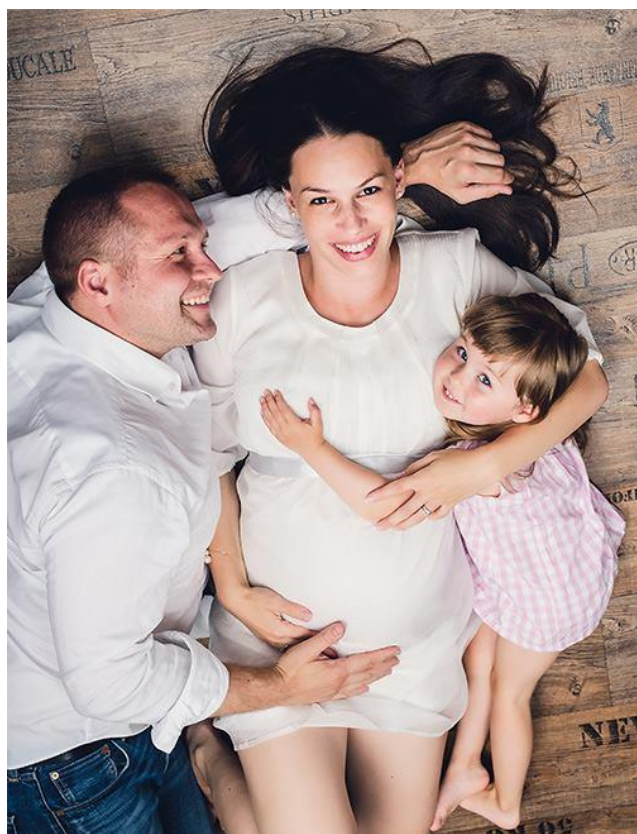
11 týdnů před porodem