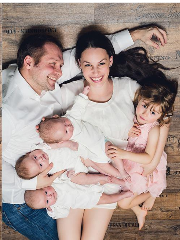
11 týdnů po narození